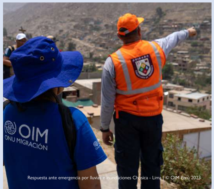
Respuesta ante emergencia por lluvias e inundaciones Chosica - Lima