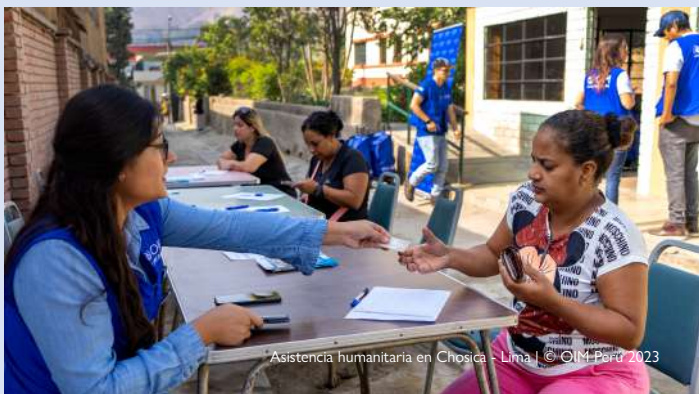
Asistencia humanitaria en Chosica - Lima

OIM lidera el sector de CCCM en el marco de la respuesta a la emergencia. Con el objetivo de mejorar la calidad de la información disponible, determinar las necesidades y facilitar la provisión de ayuda humanitaria, la OIM sigue recogiendo y sistematizando información sobre albergues establecidos a nivel nacional. Al 18 de abril, se han identificado 72 albergues activos y 1 planificado, además de 19 albergues cerrados o reubicados.