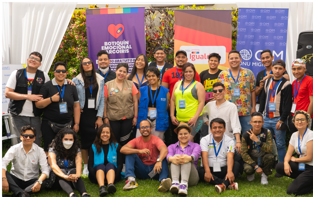
Fotos grupales de los participantes del encuentro